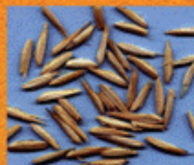
Semilla de cebadilla, Bromus unioloides

LA SEMILLA ES EL INSUMO MAS IMPORTANTE EN LA PRODUCCIÓN DE FORRAJE