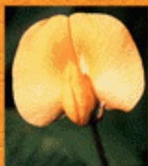
Flor de mani forrajero, Arachis pintoi