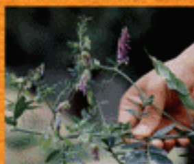
Inflorescencia y vainas de Vicia villosa ssp. dasycarpa